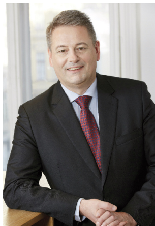
Andrä Rupprechter Landwirtschafts- und Umweltminister

Gesunder Beitrag | Österreich hat sich einer Reihe von ökologischen, soziodemografischen und medizinischen Herausforderungen zu stellen. So fühlt sich bereits jede vierte Österreicherin und jeder vierte Österreicher von Burn-out bedroht, eines von drei elfjährigen Kindern in Wien ist übergewichtig, im Jahr 2020 wird ein Viertel der Bevölkerung über 60 Jahre alt sein. Green Care soll dazu beitragen, die Gesundheit der Menschen zu erhalten, zu steigern oder wieder herzustellen. Green Care WALD bietet die Chance, die forstwirtschaftliche Kompetenz eines Betriebes mit sozialen Dienstleistungen zu verbinden und dadurch ein weiteres wirtschaftliches Standbein zu schaffen. Mit einem Fokus auf Menschen mit besonderen Bedürfnissen, Burn-out-Syndrom, Migrationshintergrund, langzeitarbeitsmarktfremde Personen, ältere Menschen, aber genauso Kinder und Jugendliche kommen wir mit Green Care WALD dem Ziel eines lebenswerten Österreichs für alle wieder einen großen Schritt näher.